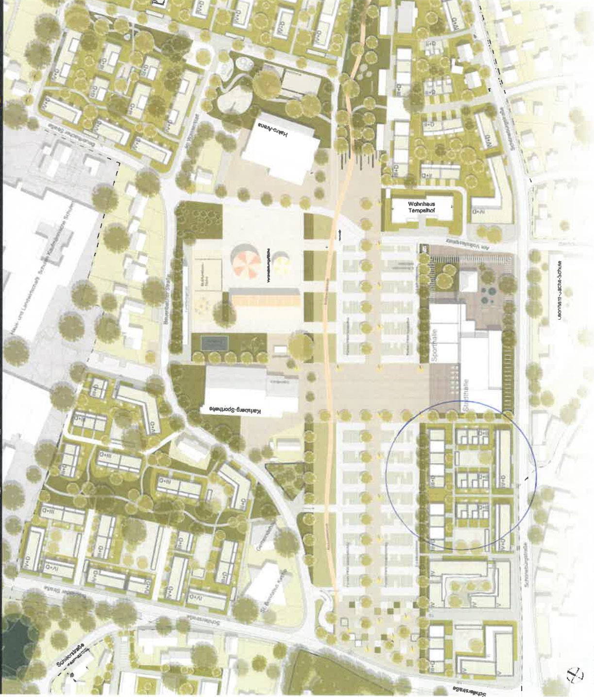
AUSSCHNITT FESTPLATZ M 1:1000