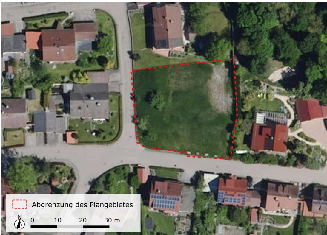
Abb. 2: Abgrenzung des Plangebietes (Kartengrundlage Luftbild)