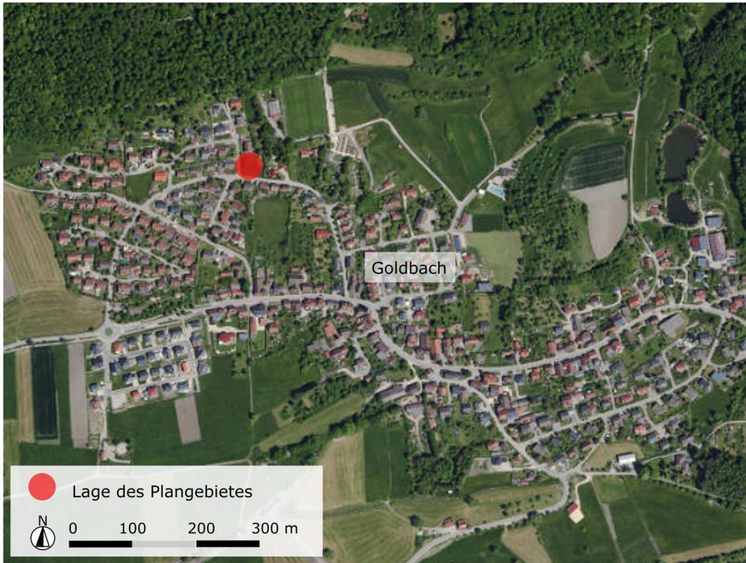
Abb. 1: Lage des Plangebietes (Kartengrundlage Luftbild)