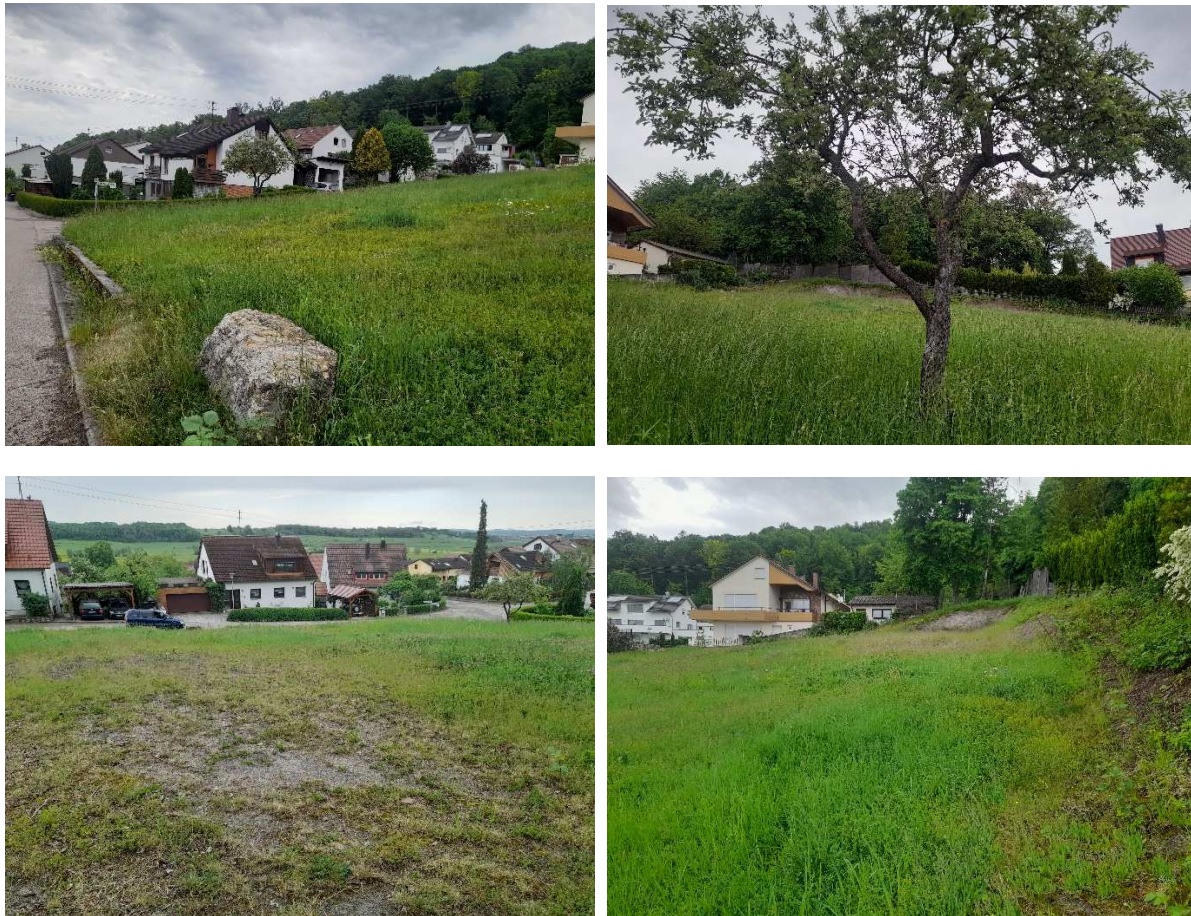
Abb. 3-6: Blicke über das Plangebiet von Südosten, Westen und Nordosten aus