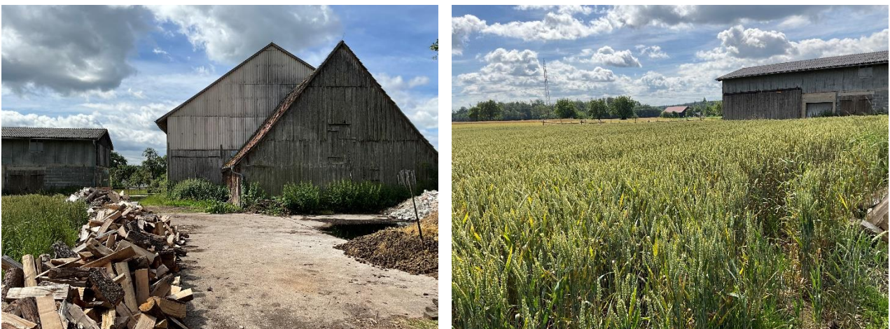
Abbildung 03: Aktuelle Nutzung mit Bestandsgebäuden im Plangebiet

Das bestehende Gehöft soll weitgehend abgebrochen werden. Die Fläche soll künftig mit zwei Hallen und einem Wohnhaus bebaut werden. Im Plangebiet soll künftig Qualitätsbrennholz produziert und gelagert werden. Da diese Nutzung im Außenbereich nicht privilegiert ist, wurde ein Bauleitplanverfahren eingeleitet.