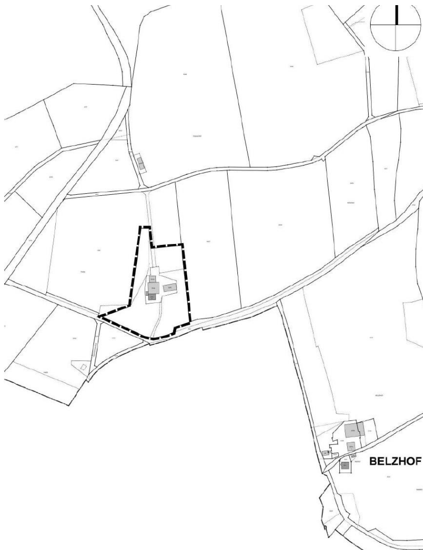
Abbildung 01: Lage des Plangebiets, unmaßstäblich