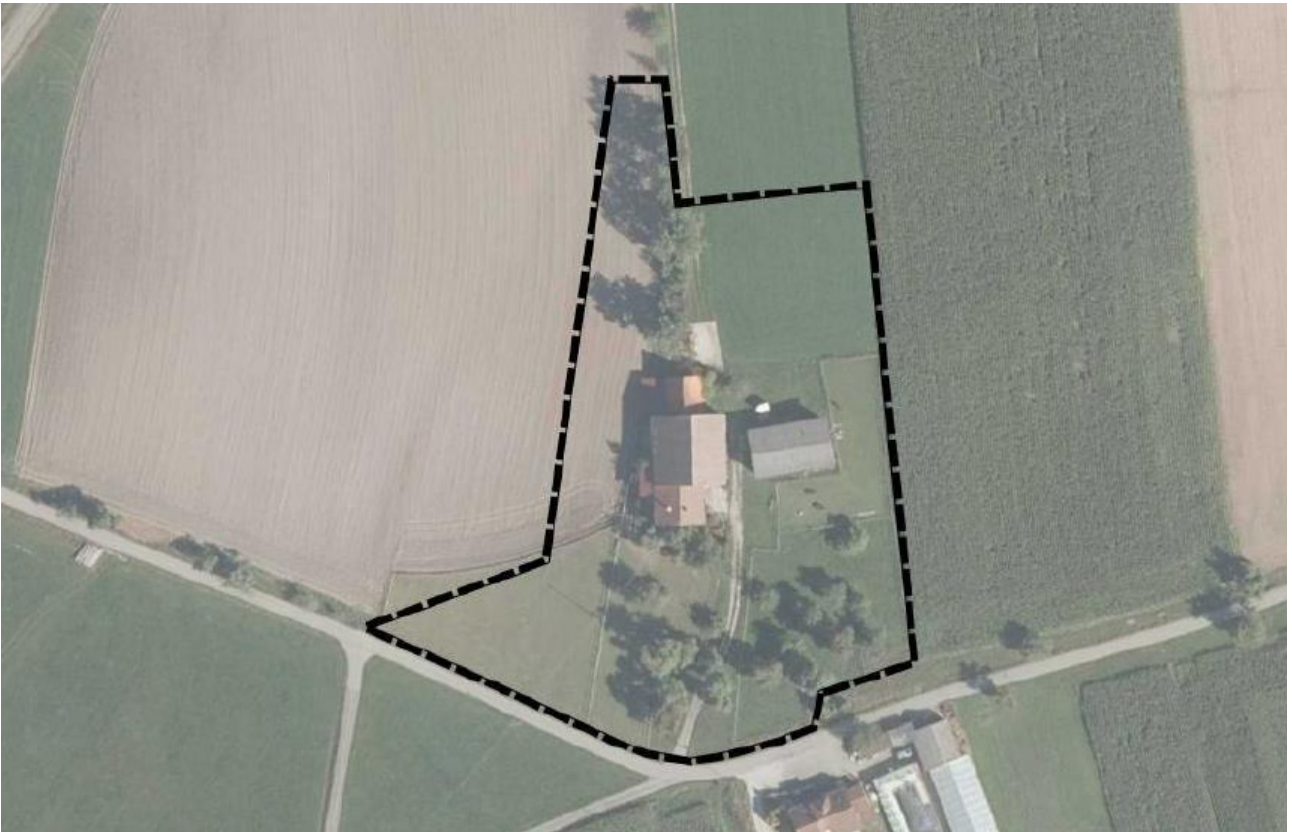
Abbildung 02: Luftbild mit Flurstücksgrenzen

Das Plangebiet 600 m vom Weiler Gauchshausen am Südrand der Gemeinde Frankenhardt. Der Geltungsbereich hat eine Größe von 1,2 ha.