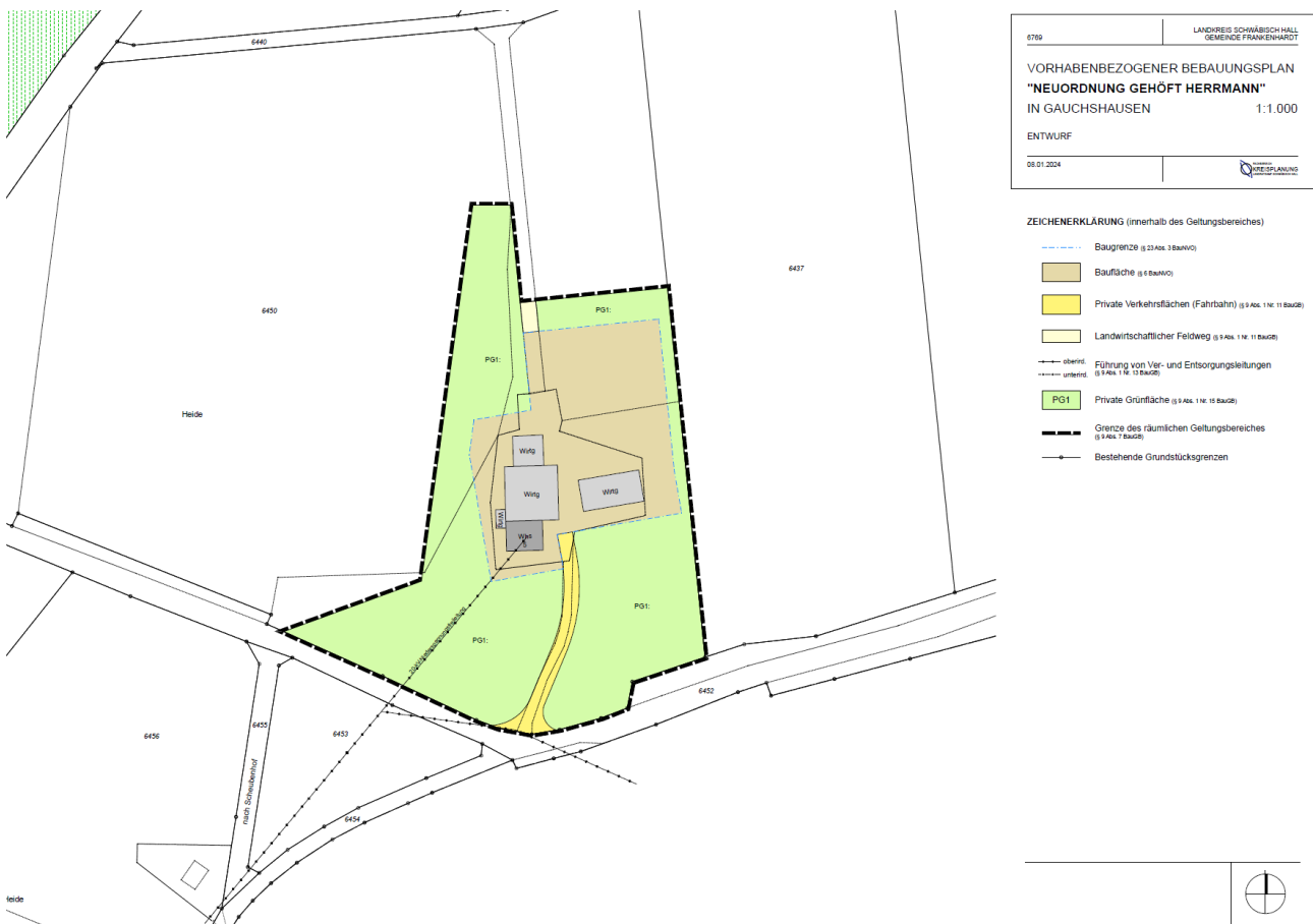
Abbildung 05: Entwurf des vorhabenbezogenen Bebauungsplans „Neuordnung Gehöft Herrmann“